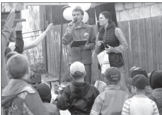
Дворовые праздники, проводимые «Жуковским Активом», популярны среди жителей всех возрастов

– Многие жители не понимают, для чего создавать ТОС, в чем преимущество такой формы организации? Территориальное общественное самоуправление означает, что люди сами участвуют в жизни своего дома и двора, сами осуществляют собственные инициативы. Теперь, когда мы стали ТОСом, круг нашей деятельности, безусловно, расширился. Важно понимать, что это добровольная общественная работа. Однако мы будем активно заниматься общественной деятельностью, потому что нам безразлична судь-