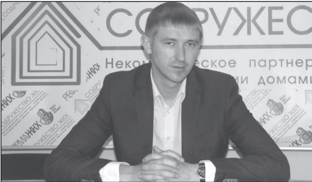
Уважаемые коллеги и жители Свердловского округа!

Девятого июня ОАО «Западное управление ЖКС» отметило свой очередной День рождения – девять лет со дня основания. Мне, как руководителю, особенно приятно осознавать, что за время своего существования компания стала мощным процветающим предприятием, которое занимает лидирующие позиции на рынке ЖКХ не только местного, но и российского уровня. В нынешнем году наша компания вошла в пятерку лучших предприятий России по итогам национального рейтинга.