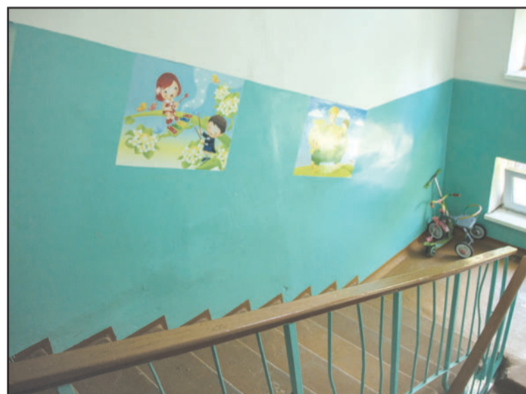
Активные жители дома №13а на бульваре Рябикова своими руками создают красоту и уют в подъездах и во дворе своего дома. Этот подъезд они решили украсить наклейками, потому что здесь почти в каждой семье есть ребятишки.