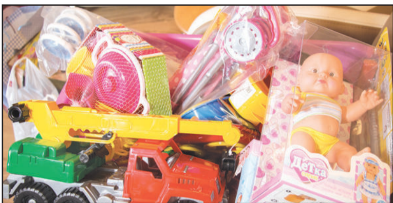
«Коробки храбрости» с игрушками для детей, больных онкологическими заболеваниями, собрали сотрудники ОАО «Западное управление ЖКС». В них находятся куклы, машинки, наборы для творчества, книги и многое другое. Все это передали детям, которые находятся на лечении в онкологическом отделении Иркутской областной детской больницы.

Сувениры для больных ребятишек приобретают неравнодушные люди. В процедурных кабинетах больниц ставят ящички, в которых находятся эти подарки.